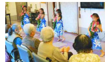
子ども達がフラダンスを披露してくれました