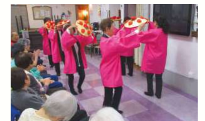
ボランティアさんのイベントの様子