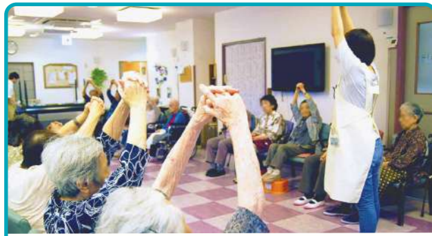
自宅での生活を長く続けて頂くために 機能訓練 (生活リハビリ)

病院での身体機能回復を目的としたリハビリに対して、銀らんの丘では生活全般の日常動作をリハビリと捉える「生活リハビリ」に取り組んでいます。普段のご自宅での動作(入浴・排泄・移動・食事など)を中心に、安全に配慮しながらご自身で出来る事はなるべくご自身で行っていただく事により、ご自宅での生活を長く楽しく過ごして頂けるように支援してまいります。