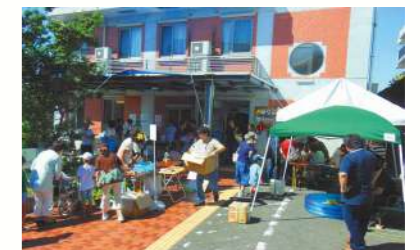
ハワイアンフェスティバル

住み慣れた環境で地域交流を通じて社会性の維持を支援します。季節に応じたさまざまな活動を行なっています。