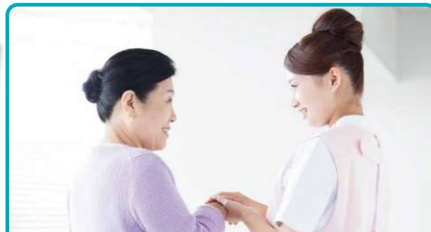
豊富な経験と知識で対応いたします 安心の医療対応

認知症を防ぐには脳トレーニングが良いことが知られています。ぬり絵や簡単なパズルやドリルなどを使用した脳トレーニング、その他、認知課題と運動を取り入れたプログラムを実践し、効果的に活性化を図ります。