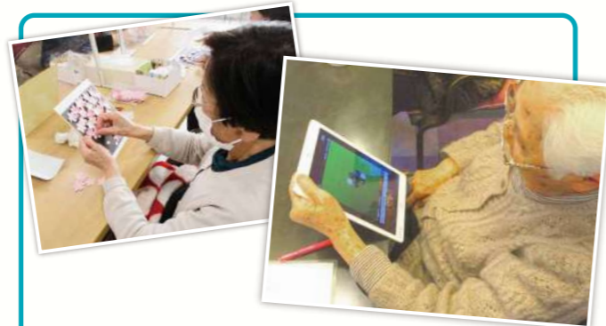
生きがいある生活のお手伝い アクティビティ

病院での身体機能回復を目的としたリハビリに対して、銀らんの丘では生活全般の日常動作をリハビリと捉える「生活リハビリ」に取り組んでいます。普段のご自宅での動作(入浴・排泄・移動・食事など)を中心に、安全に配慮しながらご自身で出来る事はなるべくご自身で行っていただく事により、ご自宅での生活を長く楽しく過ごして頂けるように支援してまいります。