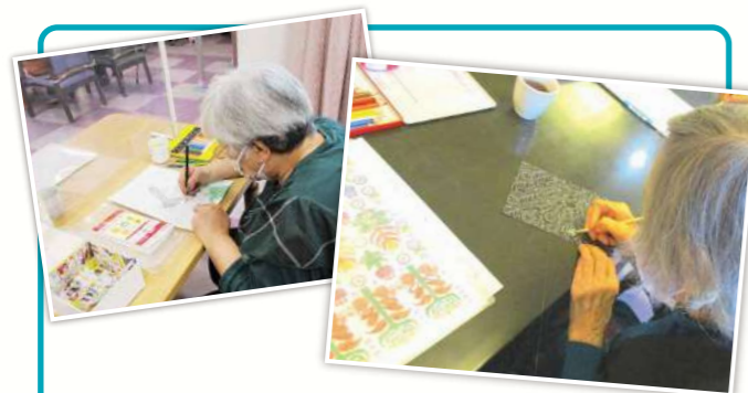
脳の活性化で認知症を予防 認知症予防プログラム

「できる力」に着目した個別の支援を行い、役割・趣味・楽しみなどを通して「生活機能」全体の向上を目指します。塗り絵やスクラッチアート、小物作りやペン習字、囲碁や将棋(囲碁・将棋・オセロ)は iPad を使用して対戦する事も出来ますなど個別活動が充実しています。また、職員企画のイベントやボランティアさんの活動も盛んです。