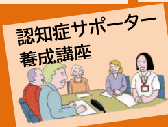
認知症サポーター 養成講座