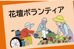
花壇ボランティア