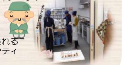
カフェ輪: 活動風景