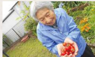
こんなに収穫できました