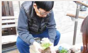
苗の植え替えの様子

園芸療法を行う目的は、ADL の改善・回復や運動機能の維持、QOL の向上などがあります。