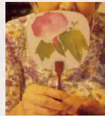
季節を感じながら ちぎり絵で作品づくり