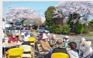
毎年恒例のお花見