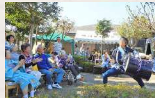
ご家族、ボランティアさん、 地域の方々が参加される交流会