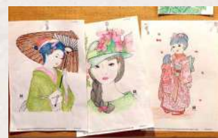
ぬり絵は脳トレーニングにもなります