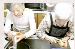
いつもお手伝いいただいております