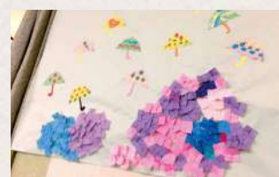
折り紙で季節を感じながら作品づくり

体操、散歩、畑づくり等、お一人おひとりのペースを尊重し支援いたします。季節を感じられるような様々な行事、外泊旅行などのイベントも企画実施しています。