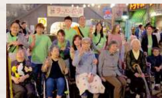
ラーメン博物館に行ってきました