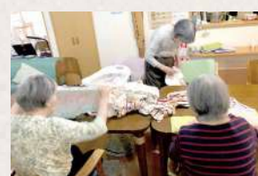
日常動作をリハビリと捉えます

日々の家事（料理・洗濯・掃除など）は生活自立能力を維持するケアの一環として、可能なかぎりご参加いただいています。