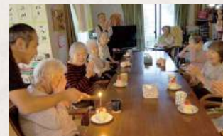
お誕生日はケーキでお祝いです